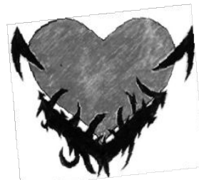
Desenho de Jéssica Patrícia de Lima

A gravidez na adolescência também pode trazer graves problemas interferindo no crescimento da jovem. Podem acontecer complicações na gravidez, alterações no desenvolvimento de seu corpo, problemas de parto, bem como o seu comportamento, sentimental e emocional pode sofrer alterações, além de causar problemas em sua área educacional e de aprendizagem.